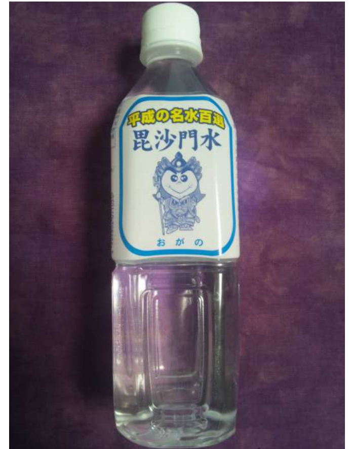
埼玉県小鹿野町さんの名水百選に 選ばれている「毘沙門水」