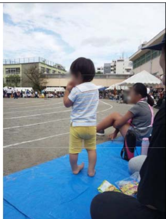
町民大運動会のひとコマ(みんな頑張れー)