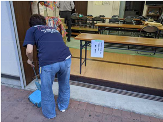
配布場所と神輿虫干しの場所の清掃