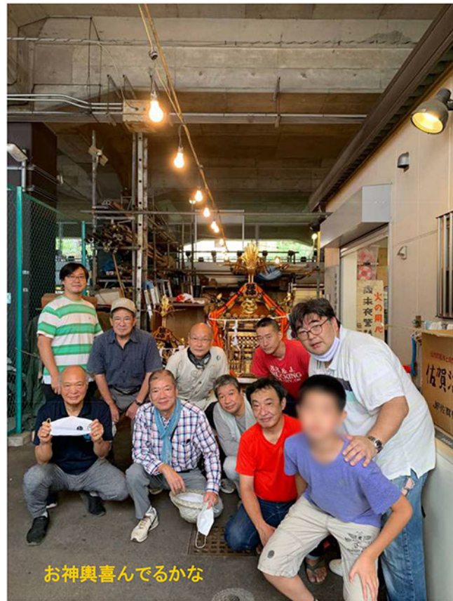
お神輿喜んでるかな