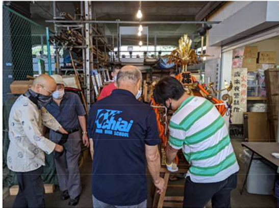
神輿をみんなで出して