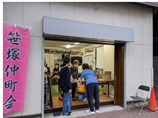
カウンター受け取りの様子と大口の配布