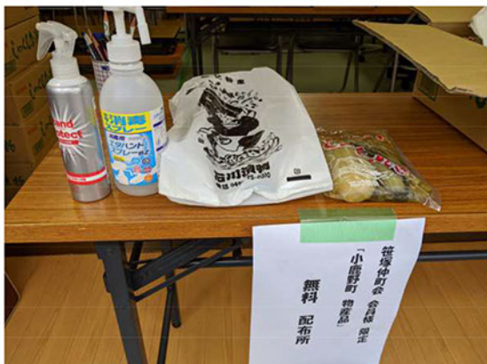
配布カウンター(引換券準備ありがとうございます)