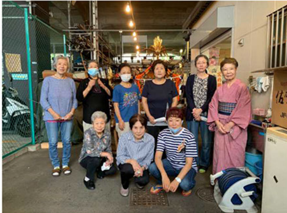
町会の「きれいどころ」と「いいおとこ」たち