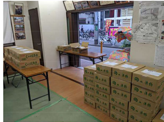
しやくし菜漬けの受領と配布カウンター準備