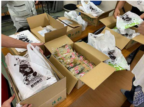
しゃくし菜漬の袋詰め作業(けっこう疲れる)