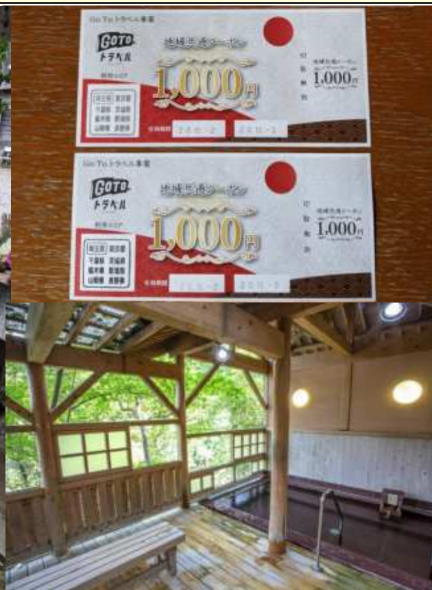
訪問当日の小鹿野町ダリヤ園にて 小鹿野高校生の竹あかり(小鹿神社) 利用した国民宿舎風呂とGoToクーポン