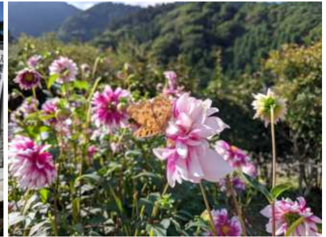
小鹿野町の皆さんで運営しているダリヤ園