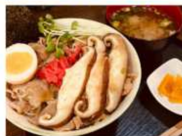
調理例：しいたけ肉丼

プリプリ食感♪ジューシー♪ バター醤油、天ぷら、お鍋、肉詰め 野菜炒め、ステーキなど楽しくお料理♪