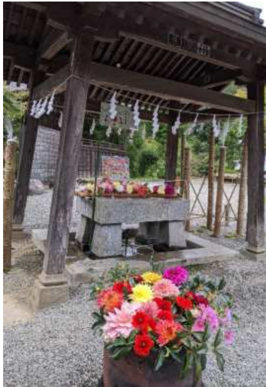
手水舎などにきれいな花が飾られていました。小鹿神社にて。