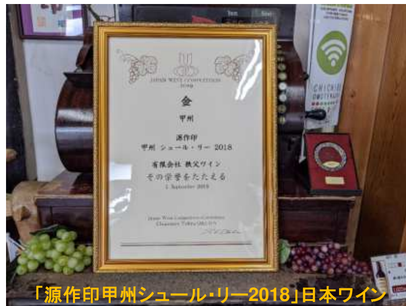
「源作印甲州シュール・リー2018」日本ワイン コンクール2019において4年連続金賞受賞