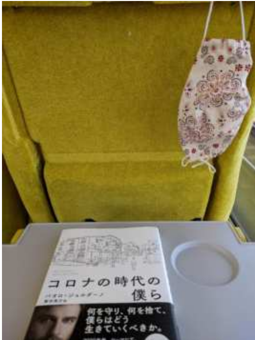
池袋から西武鉄道新型特急ラビューに乗れました 持参した読んでなかった本と、マスク