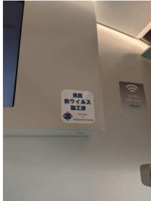
車内に貼られていた 抗菌抗ウイルス施工済シール